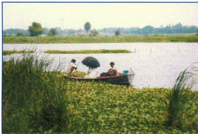
झील से वैज्ञानिक नमुना का संग्रहण