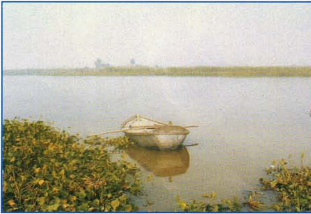
▲ महाने झील