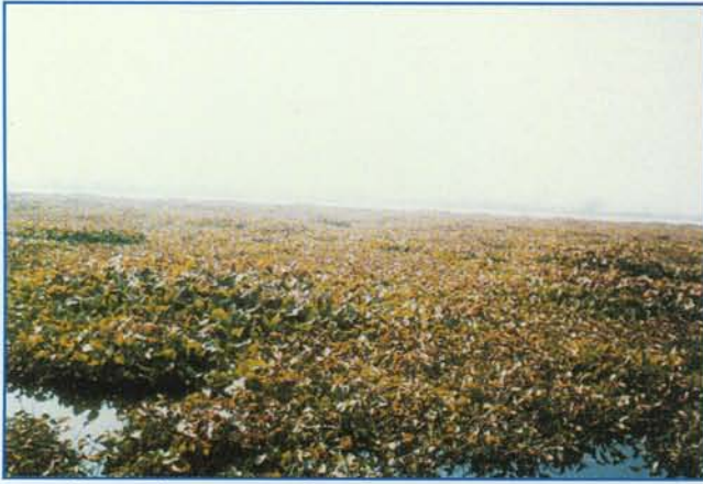
जलीय पाढपों द्वारा आच्छादित झील