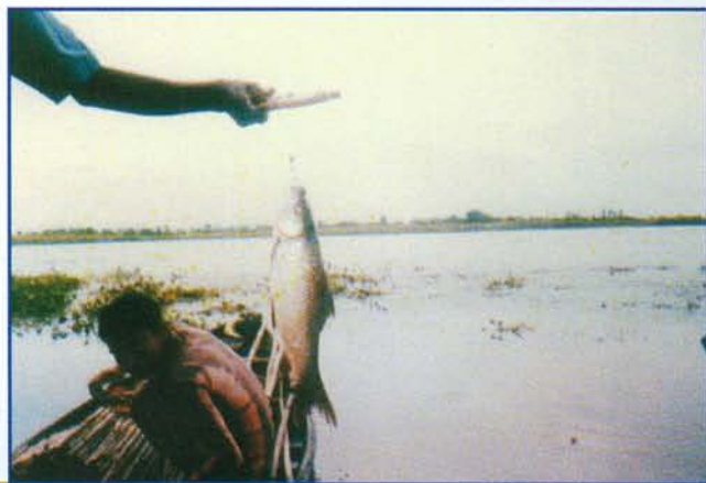
रमियाबेहर झील से कांटे द्वारा पकड़ी गयी रोहु ▲