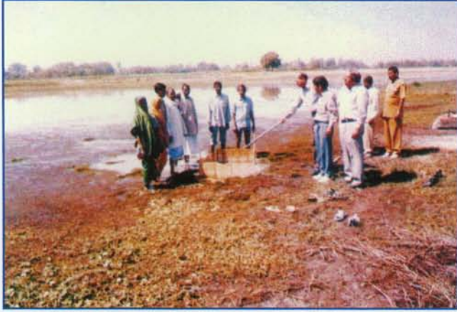
▲ झील मात्स्यिकी पर व्यावहारिक प्रशिक्षण