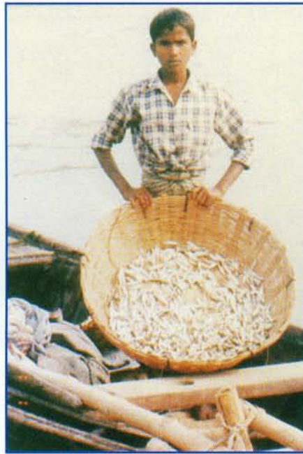
झील में सिंघाड़ा खेती