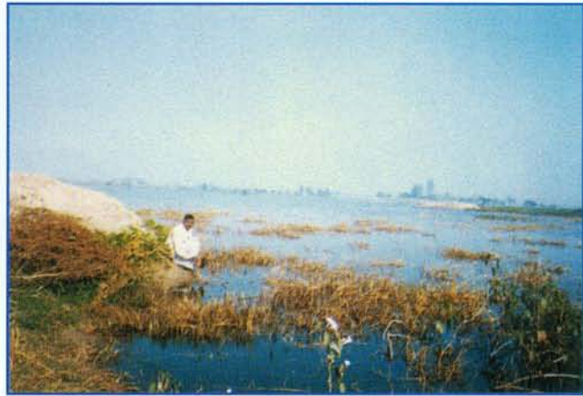
बहौसी झील ▲