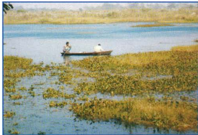
रमियाबेहर झील ▲