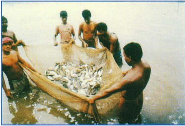
जाल द्वारा पकड़ी गयी मछलियां ▲