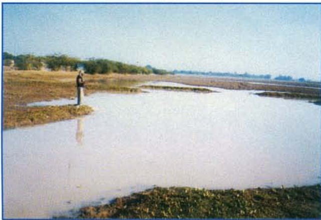
▲ अहीरवन झील