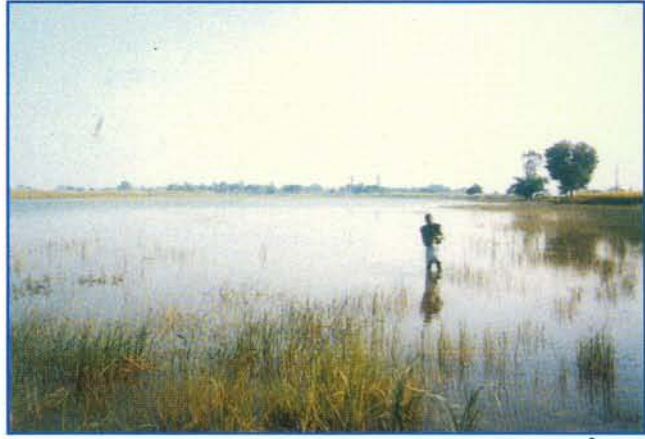
रतनपुर झील ▲