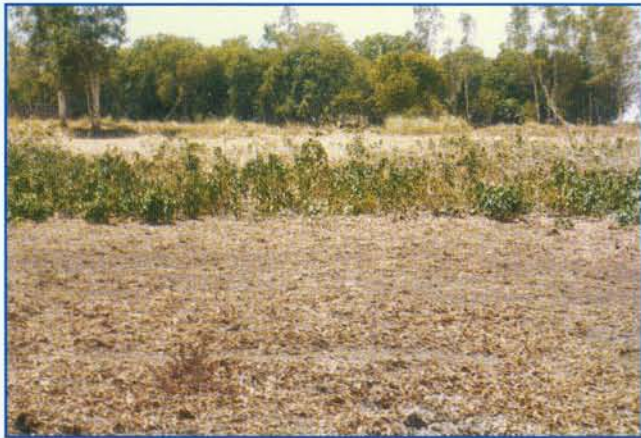
ग्रीष्मकाल में झील के किनारों का वृक्ष्य