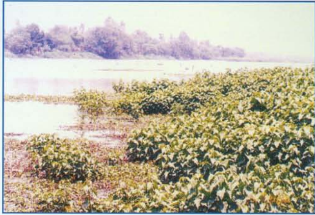
पाढप आच्छादित झील कानारे