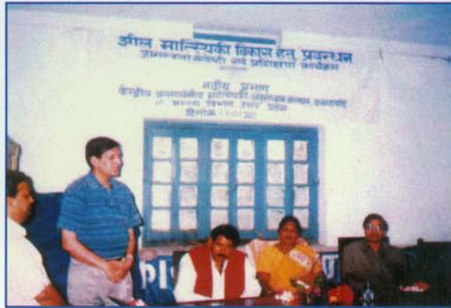
झील मात्स्यिकी प्रबन्ध प्रशिक्षण ▲