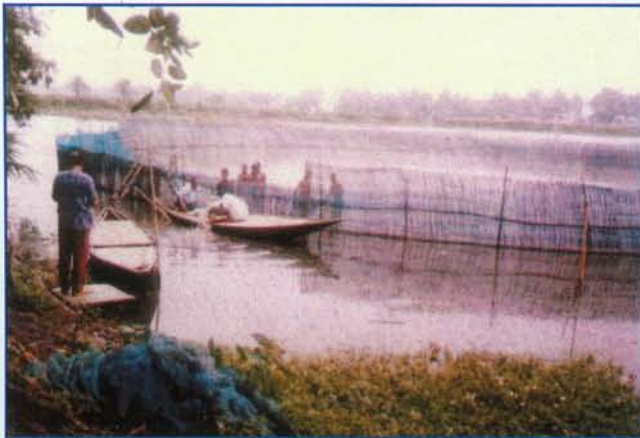
▲ झील मत्स्य उत्पादन वृद्धि हेतु उपयोगी मत्स्य बाड़ा (पेन)