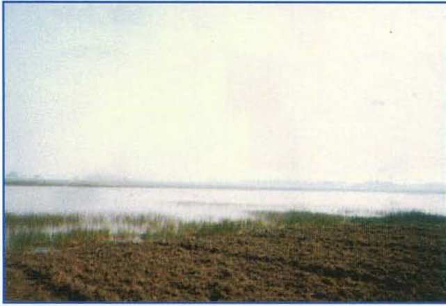
▲ सामन झील