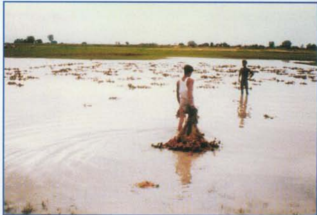
झील में सिंघाड़ा खेती